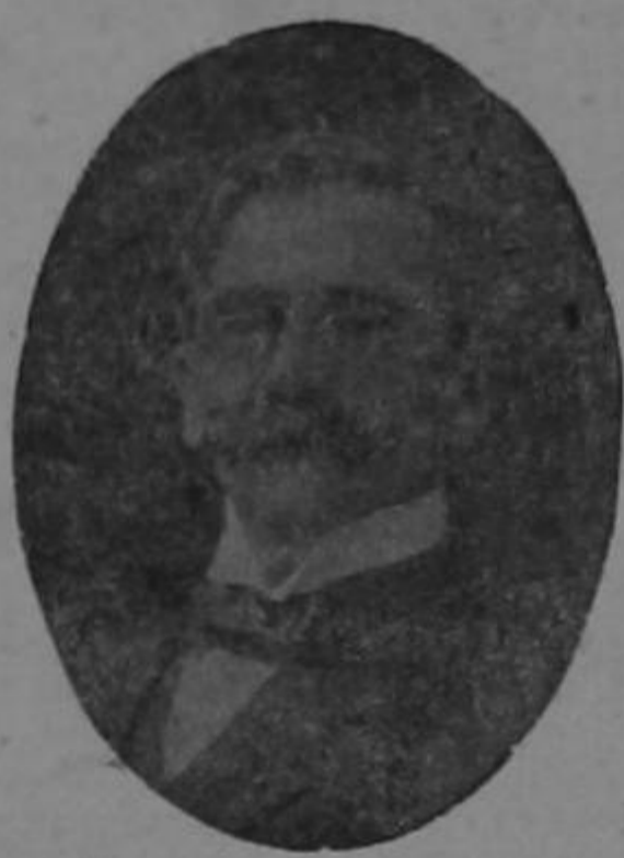
DOCTOR DON BELISARIO PORRAS

investigador honrado, anticipándose con precipitud culpable a emitir juicios apasionados, hiperbólicos y contradictorios acerca del hombre y su obra que no dejan lugar a otra salida que a la de considerarlo como un semidios o como un hombre cualquiera. La posteridad tendrá, pues, que escu-